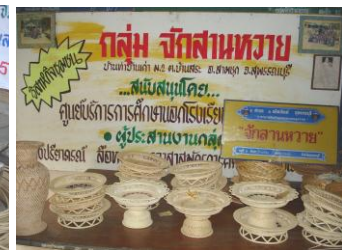
สินค้าที่กลุ่มจักสานหวาย ผลิตเพื่อจำหน่าย