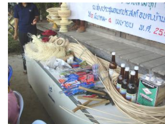
อุปกรณ์ในการจักสานหวาย