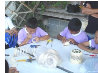
การขึ้นลวดลาย