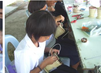
การขึ้นรูปแจกัน