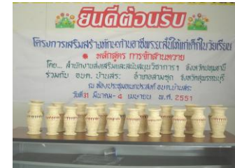
การจักสานหวายสำเร็จรูป

กลุ่มจักสานหวายทำบ้านเก่า ตั้งอยู่บ้านเลขที่ ๑๙๐ หมู่ที่ ๒ ตำบลบ้านสระ อำเภอสามชุก จังหวัดสุพรรณบุรี